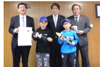
平成27年の全国大会で3位になり、市長、教育長に報告しました!