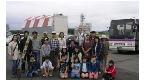
平成22年大樹町全道大会の様子